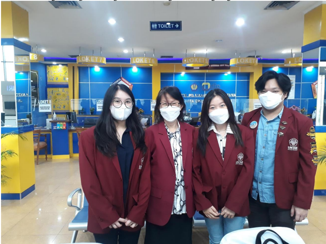
Gambar 1. Kegiatan luring di KPP Grogol Petamburan

Berikut adalah gambar-gambar kegiatan selama kegiatan berlangsung: