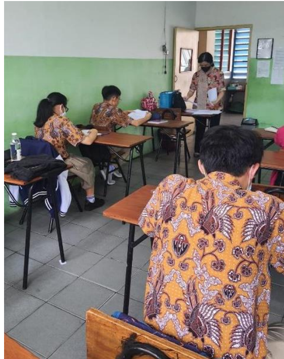
Gambar 3. Pelaksanaan PKM Sesi Kedua

Penyampaian materi pelatihan dapat dikelompokkan menjadi 5 bagian. Bagian pertama menjelaskan mengenai siklus pembelian dan transaksi yang termasuk dalam siklus pembelian. Bagian kedua menjelaskan mengenai formulir-formulir transaksi pembelian yang tersedia dalam software Accurate. Bagian ketiga menjelaskan mengenai pengaturan perangkat keras yang perlu disesuaikan dengan spesifikasi software Accurate. Bagian keempat menjelaskan mengenai langkah penginputan transaksi pembelian yang terjadi ke dalam formulir yang sesuai. Bagian kelima menjelaskan mengenai cara untuk menampilkan laporan terkait transaksi pembelian. Tabel 2 menjelaskan mengenai rincian penyampaian materi pelatihan disertai dengan tujuannya.