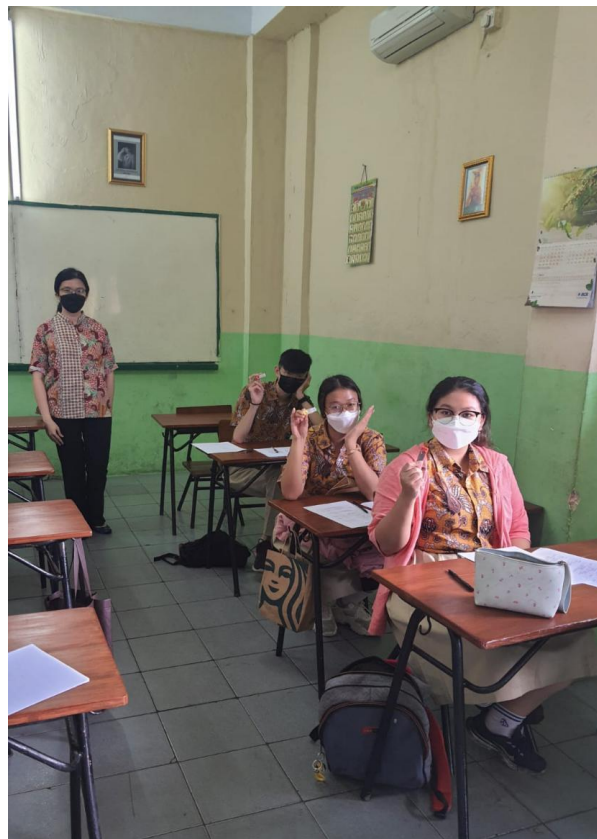
Gambar 2. Pelaksanaan PKM Sesi Pertama

Pada saat pelaksanaan, pelatihan dilakukan dengan memberikan penjelasan mengenai transaksi dalam siklus pembelian. Kemudian diikuti dengan pengerjaan soal dimana tim PKM menjelaskan mengenai cara penginputan ke dalam software Accurate. Kegiatan pelatihan dilakukan dalam 2 sesi, dimana sesi pertama diikuti oleh siswa/i kelas XII IPS dan sesi kedua diikuti oleh siswa/i kelas XII IPA. Foto bersama dengan siswa/i SMA Kristen Yusuf dapat dilihat pada Gambar 2 dan Gambar 3.