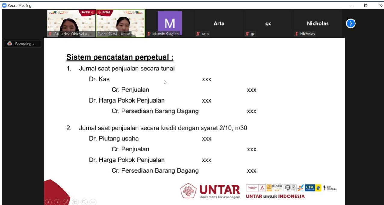
Gambar 1. Sesi Pelatihan