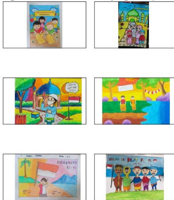
Gambar 6: Karya Mewarnai dan Menggambar Terbaik

( c ). Komposisi warna yang terdiri dari variasi warna yang diterapkan dan teknik gradasi warna.