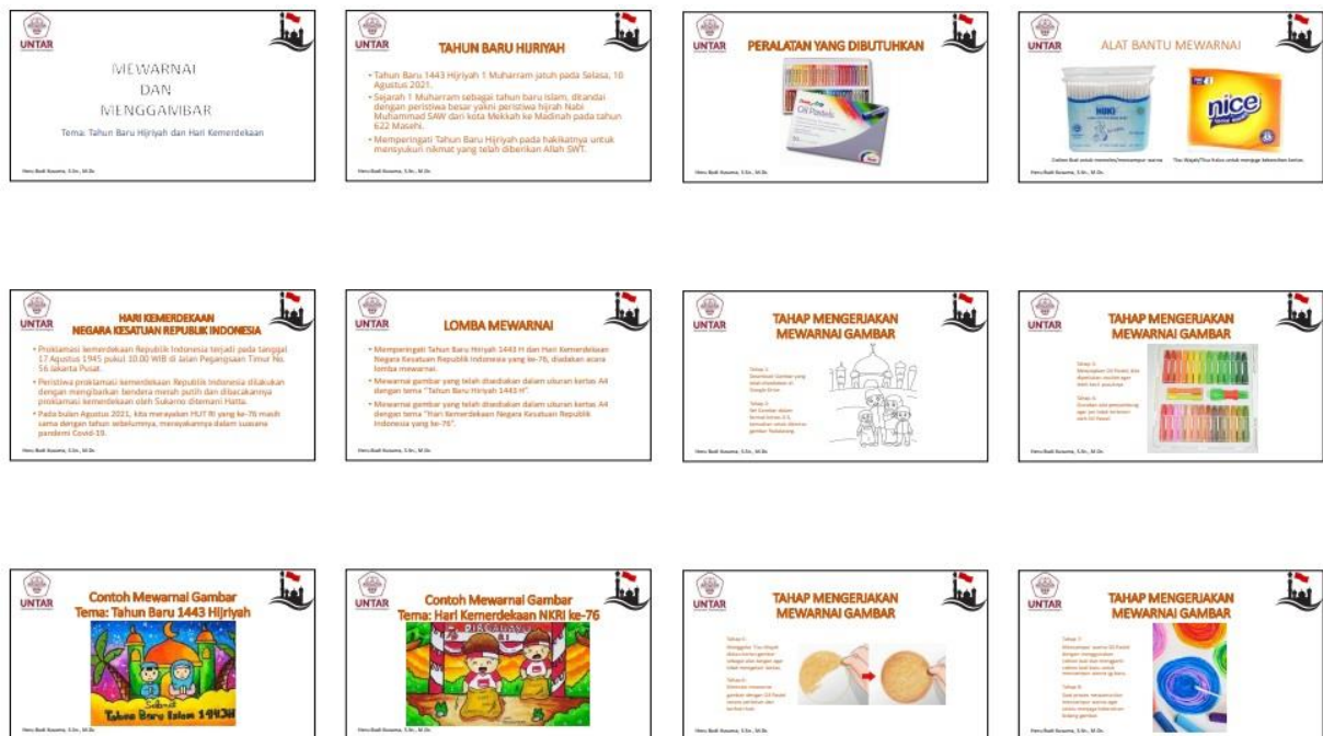
Gambar 1: Materi Pelatihan 1

Pelatihan mewarnai gambar, menggambar dan gambar bercerita disampaikan secara daring kepada 22 guru wali kelas dari kelas 1 hingga kelas 6. Hasil dari kegiatan pelatihan dilanjutkan oleh masing-masing guru wali kelas kepada murid-muridnya. “Tahun Baru 1443 Hijriyah” dan “Hari Kemerdekaan Negara Kesatuan Republik Indonesia ke-76” merupakan Tema yang telah ditetapkan oleh Kepala Sekolah dan Wakilnya sebagai kegiatan lomba yang harus diikuti oleh seluruh murid kelas 1 sampai dengan kelas 6.