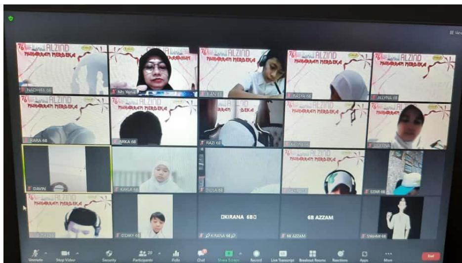
Gambar 3: Materi Disampaikan Secara Daring

Materi pelatihan diberikan kepada guru wali kelas, kemudian disampaikan kepada murid-murid kelas 1 sampai dengan kelas 6. Materi disampaikan secara daring karena Kota Tangerang Selatan saat itu dalam kondisi Pemberlakuan Pembatasan Kegiatan Masyarakat (PPKM) Level 4.