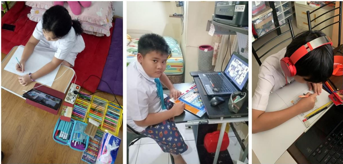
Gambar 4: Murid-murid Mewarnai dan Menggambar di Rumah Masing-masing

Proses penilaian diawali dari seleksi yang dilakukan oleh masing-masing guru wali kelas yang menghasilkan 3 karya terbaik kepada Tim Juri Sekolah. Dikarenakan sedang masa PPKM Level 4 maka proses penjurian dilakukan secara daring.