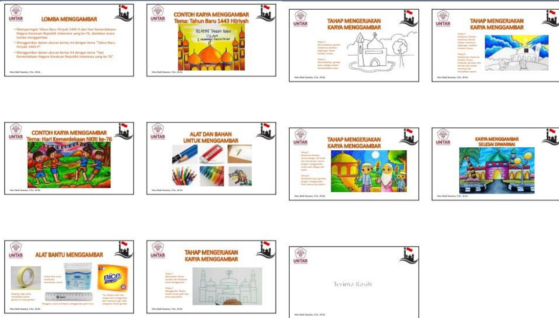
Gambar 2: Materi Pelatihan 2

Materi pelatihan diberikan kepada guru wali kelas, kemudian disampaikan kepada murid-murid kelas 1 sampai dengan kelas 6. Materi disampaikan secara daring karena Kota Tangerang Selatan saat itu dalam kondisi Pemberlakuan Pembatasan Kegiatan Masyarakat (PPKM) Level 4.