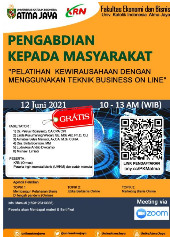
Gambar 1 Undangan Kepada Peserta Untuk Mengikuti Kegiatan Pelatihan