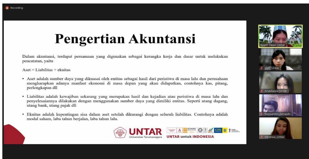
Gambar 1 Sesi pelatihan

Berdasarkan penyuluhan ini, hasil yang kami dapat selama pelatihan berlangsung, terdapat banyak minat dari siswa dan siswi SMA untuk melanjutkan ke perguruan tinggi terutama jurusan akuntansi ataupun manajemen. Hal ini dikarenakan, pekerjaan mudah didapat setelah mereka lulus sekolah menengah atas dan kuliah, serta berguna untuk pengembangan karir mereka di masa yang akan datang. Hasil pelatihan yang diadakan selama kegiatan berlangsung, dapat dilihat di gambar 1 (satu) dan 2 (dua).