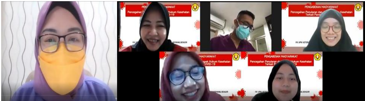
Gambar 1. Sambutan dari Ka Klinik Cahaya Kemang dan Penyuluhan Pencegahan Penularan Covid-19 dan Pemahaman Hukum Kesehatan Terkait Pandemi Covid-19 oleh Tim Penyuluh Universitas Pembangunan Nasional Veteran Jakarta

Evaluasi hasil pre test didapatkan bahwa belum semua peserta memahami pentingnya mengetahui pencegahan penularan Covid-19. Demikian pula tentang pengetahuan hukum kesehatan terkait pandemi Covid-19. Banyak dari mereka yang belum memahami tentang Pencegahan Penularan Covid-19 dan Pemahaman Hukum Kesehatan Terkait Pandemi Covid-19.