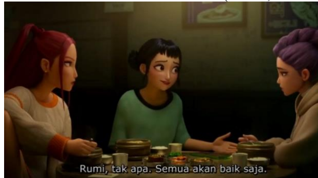
Gambar 3. Makanan Tradisional Korea (Menit, 19:42 – 21:17)

Dokkaebi adalah makhluk mitologi Korea yang dikenal sebagai “Goblin Korea.” Mereka digambarkan nakal namun dermawan, berasal dari benda lama, bukan roh manusia. Wujudnya berwajah merah, bermata besar, bertaring, kadang berkaki satu. Makhluk ini gemar berinteraksi dengan manusia, bahkan dapat berubah menjadi manusia untuk berbaur atau menipu lawan. Mereka juga identik dengan benda magis seperti Bangmangi (tongkat pembawa harta) dan Gamtu (topi gaib). Meski menyeramkan, Dokkaebi dihormati sebagai simbol keberuntungan, pelindung, dan pemberi panen melimpah.