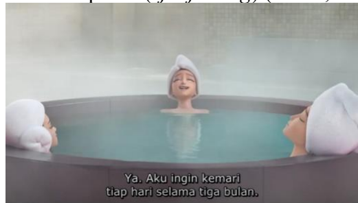
Gambar 7. Pemandian air panas ( Jjimjilbang ) (Menit, 01:24:25 – 01:24:56)

Dalam budaya Korea, maedeup adalah hiasan simpul dari tali yang berfungsi sebagai aksesoris sekaligus simbol harapan akan keberuntungan, kedamaian, dan umur panjang. Dalam film K-pop Demon Hunters , simpul dongsimgyeol digambarkan sebagai lambang cinta abadi. Seni simpul ini berkembang sejak era Tiga Kerajaan, mencapai puncak di masa Joseon sebagai penanda status sosial istana, lalu sempat meredup karena pengaruh busana Barat. Kini, maedeup tetap dilestarikan melalui desain modern.