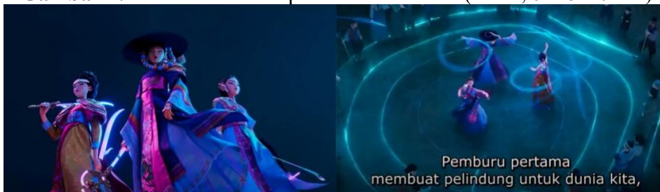
Gambar 1. Shamanisme dan pakaian tradisional (Menit, 01:15 – 01:42)

sempat menjadi tayangan nomor satu di Netflix. Ceritanya menampilkan beragam budaya Korea, baik tradisional maupun populer, sebagai bagian dari strategi hallyu untuk menjangkau pasar global. Peneliti melakukan pengamatan pada film K-pop Demon Hunters untuk diteliti dan menampilkan beberapa potongan dari scene pada film tersebut. Dalam proses ini, peneliti menggunakan analisis semiotika Roland Barthes, yang dimana teori semiotika Roland Barthes mengkaji sebuah tanda atau simbol yang memiliki makna denotasi, konotasi, dan mitos yang dapat mengupas arti dan makna dari simbol atau tanda yang ditunjukkan dalam film K-pop Demon Hunters (Wibisono & Sari, 2021).