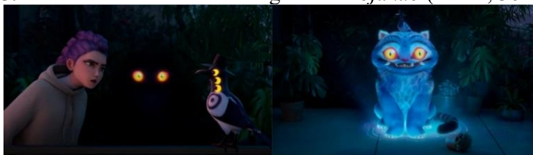
Gambar 5. Lukisan harimau dan burung murai Hojakdo (Menit, 36:40 – 38:05)