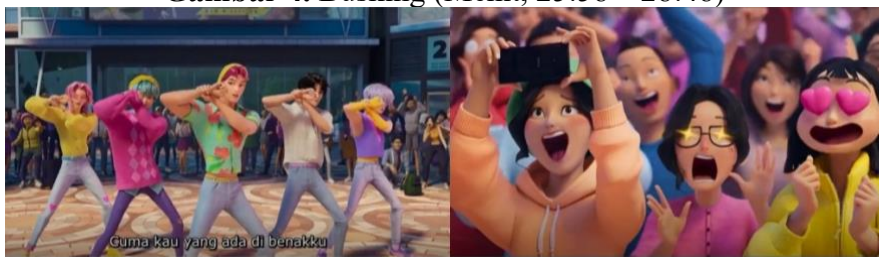
Gambar 4. Busking (Menit, 25:58 – 28:48)

Masyarakat Korea memiliki beragam makanan tradisional yang dipercaya bermanfaat bagi kesehatan. Salah satunya adalah Samgyetang , sup ayam ginseng yang biasa dikonsumsi untuk memulihkan energi saat sakit. Hidangan ini juga menjadi tradisi pada tiga hari terpanas musim panas (Chobok, Jungbok, Malbok), berlandaskan prinsip i-yeol-chi-yeol —menghadapi panas dengan panas—di mana kehangatan sup diyakini mampu menyejukkan tubuh dari dalam sekaligus memperkuat stamina.