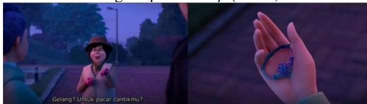
Gambar 6. Gelang simpul Madeup (Menit, 50:50 – 51:35)

Derpy dan Sussie merupakan referensi karya lukisan dari era Jeoson. Lukisan tersebut merupakan ilustrasi dari seekor harimau yang melambangkan pelindung dan juga burung gagak ( magpie ) yang melambangkan pembawa kabar baik. Korea dahulu dikenal sebagai “negeri harimau”, meski kini harimau telah punah di wilayah Selatan. Dahulu, harimau hidup di pegunungan dan kadang turun ke desa, menimbulkan ketakutan sekaligus rasa hormat. Karena itu, harimau dijuluki “pangeran gunung.” Sebaliknya, burung gagak ( magpie ) di Korea disebut “pembawa sukacita” karena diyakini membawa kabar baik atau tamu. Di Tiongkok, magpie melambangkan kebahagiaan pernikahan. Kisah dalam Shenyi Jing (abad ke-4) menceritakan cermin yang dihiasi magpie sebagai simbol kesetiaan pasangan. Dua belas magpie juga dimaknai sebagai dua belas harapan tulus. Dalam lukisan tradisional Hojak-do ( ho = harimau, jak = magpie , do = lukisan), magpie digambarkan bertengger di pohon pinus, sementara harimau di bawahnya tampak bodoh. Harimau melambangkan otoritas kelas bangsawan ( yangban ), sedangkan magpie tampil bijak dan bermartabat.