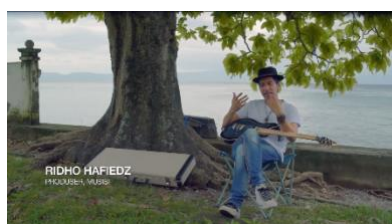
Tabel 4. Scene Musisi Scene 10 – Menit (49:16 - 52:13)