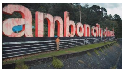
Scene 1 - Menit (1:48 - 1:58)