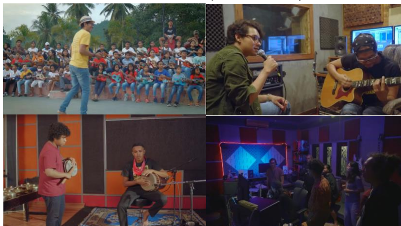
Tabel 3. Scene Makna Scene 8 – Menit (34:11 - 37:47)