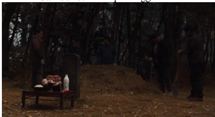
Gambar 5. Ritual pemanggilan roh

Kariana (2025) memaparkan bahwa simbol religius bekerja melalui struktur makna yang diaktifkan oleh komunitas yang menggunakannya, sehingga benda ritual dalam film memikul fungsi representatif sebagai penyampai pesan leluhur. Representasi ritual dalam Exhuma menyusun pola komunikasi spiritual yang terbentuk dari interaksi antara benda sakral, energi simbolik, dan respons manusia yang menjalankan proses mediasi melalui keyakinan budaya.