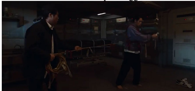
Gambar 4. Ritual pemanggilan roh

Polidoro & D'Aloia (2023) menjelaskan bahwa tubuh aktor dalam film dapat berperan sebagai tanda visual yang menggambarkan kehadiran entitas eksternal melalui transformasi ekspresi dan perilaku, sehingga fenomena trance memperlihatkan struktur komunikasi metafisik yang terbentuk melalui performativitas tubuh. Yaqin & Faris (2022) menegaskan bahwa pengalaman spiritual dapat muncul melalui respons tubuh yang dipahami sebagai bagian dari proses mediasi energi, sehingga tubuh Bonggil berfungsi sebagai medium yang memungkinkan pesan roh diartikulasikan kepada manusia.