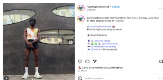
Gambar 1. Konten Media Sosial @runningshoesworld

Keuntungan: membuka peluang masuk ke komunitas olahraga global yang lebih luas melalui endorsement tidak langsung.