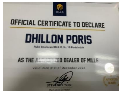
Gambar 4. Official Certificate