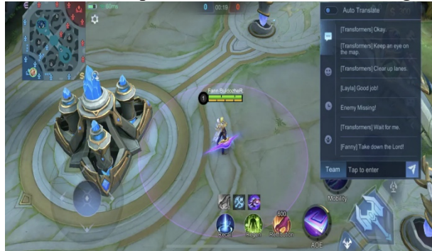
Gambar 2. Tampilan Pesan dalam Mobile Legends

Mobile Legends Bang Bang adalah permainan kompetitif yang menawarkan pemain lebih dari sekedar hiburan. Untuk menang dalam permainan Mobile Legends Bang Bang, semua orang harus memiliki strategi dan berkomunikasi dengan baik satu sama lain. Jason Christian, pelatih tim Infinity, juga mengatakan bahwa semua orang harus memiliki strategi dan dapat membaca strategi lawan dan melawan mereka dengan cepat dan akurat dalam pertempuran (Gambar 1). Pemain juga bisa memanfaatkan fitur yang ada di game Mobile Legends untuk membantu perencanaan strategi komunikasi (Gambar 2).