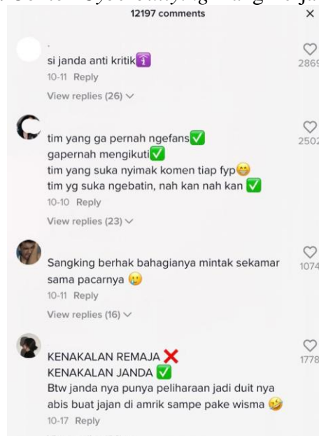
Gambar 2. Contoh Cyberbullying Yang Terjadi Di TikTok