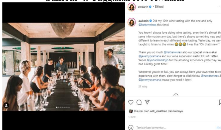
Gambar 4. Unggahan foto Awkarin

Postingan foto pada gambar 3 menunjukkan Awkarin sedang bermain jetski. Terlihat juga pada caption yang Awkarin tulis yaitu "I miss my girlfriends... by girlfriends I mean, my jetski" yang artinya Awkarin juga memiliki jetski tersebut. Hanya untuk menyalurkan hobinya bermain jetski, Awkarin menghabiskan uang hingga Rp500 juta untuk membeli alat jetski (Idntimes.com, 2021).