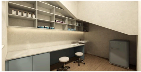
Desain Area Farmasi Klinik

Karena luas ruang yang terbatas maka area lobby dan ruang tunggu menjadi satu kesatuan sebuah area, untuk area administrasi berada pada sebelah kiri saat memasuki entrance pada bagian depan dan alur selanjutnya akan mengikuti alur pada kegiatan aktivitas klinik yaitu ruang tunggu. Guna mengoptimalkan tata ruang pada ruang yang terbatas maka perancangan dari penataan tersebut hanya mengoptimalkan dari aspek tata letak sebuah furnitur meja kasir dan display produk yang cukup.