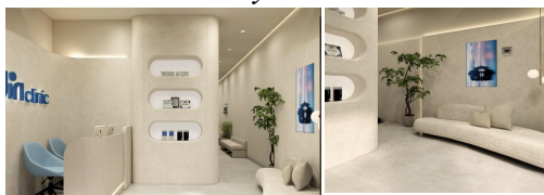
Desain Area Lobby Klinik

Permasalahan selanjutnya yaitu permasalahan pada ruang farmasi yang memiliki luas ruang 2,1 m x 2,9 m karena letak ruang farmasi berada pada bawah tangga maka tempat penyimpanan yang digunakan juga cukup minim, maka dari hal tersebut dapat disimpulkan aktivitas yang dilakukan para staf sangat terbatas dan tingkat kenyamanan yang kurang optimal.