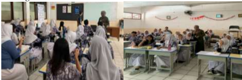
Gambar 3 Foto kegiatan PKM