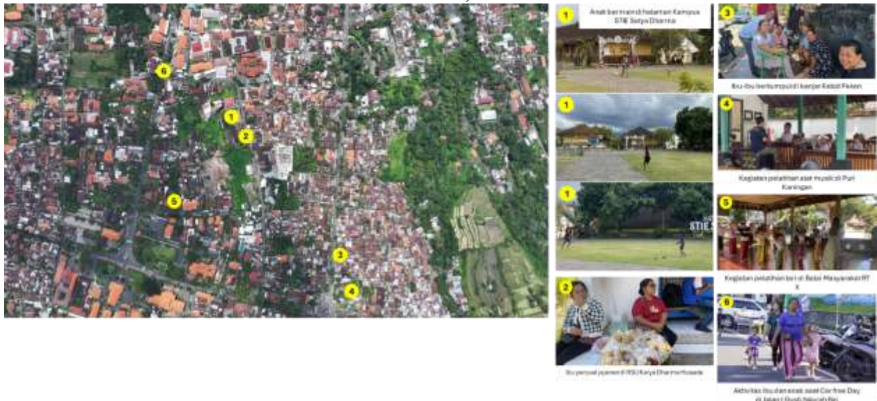
Persebaran Titik Kegiatan Perempuan, Ibu dan Anak di Kelurahan Kendran