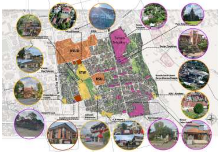
Persebaran Fasilitas Sosial-Budaya di Kelurahan Kendran

Melalui gambar di atas, terlihat bahwa cukup banyak fasilitas social budaya yang dapat mendukung pengembangan RBI di Kelurahan Kendran. Pada dasarnya, Bali sudah memiliki adat yang kuat dimana Banjar sangat berperan dalam kehidupan sehari-hari Masyarakat di Bali. Kelurahan Kendran terbagi menjadi 2 Banjar, yaitu Banjar Delod Peken dan Banjar Penataran yang tergambar dengan lebih jelas pada gambar 7 di bawah ini.