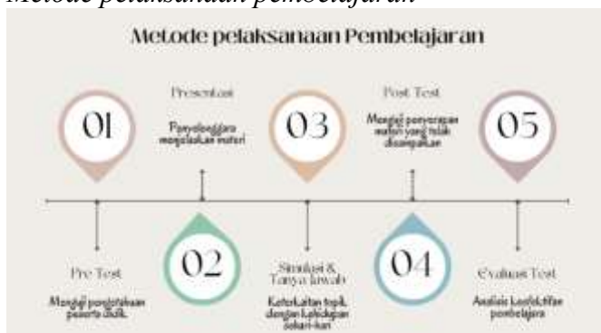
Metode pelaksanaan pembelajaran

Kegiatan PKM ini dijalankan oleh tim PKM dari FEB Untar dengan 1 (satu) orang dosen sebagai ketua dan 2 (dua) orang mahasiswa sebagai anggota. Ketua tim adalah dosen tetap prodi S1 Akuntansi dengan latar belakang mengajar di Akuntansi dasar, Akuntansi Biaya dan Manajemen. Sedangkan anggota tim adalah 2 orang mahasiswi yang merupakan mahasiswi prodi S1 Akuntansi.