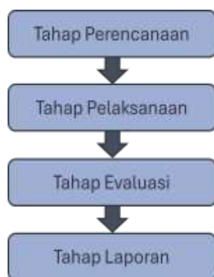
Gambar 1. Tahapan Kegiatan PKM

Kegiatan PKM ini dalam bentuk pelatihan tentang cara penyusunan jurnal umum serta pemaparan tentang perbedaan debit dan kredit di perusahaan jasa. Ada beberapa metode pelaksanaan pelatihan. Dalam kesempatan pelatihan ini, metode pelaksanaan pelatihan yang digunakan adalah metode konvensional dengan menggabungkan metode ceramah, diskusi, tanya jawab dan latihan soal (Sudjana, 2010). Adapun tahapan pelaksanaan pelatihan ditunjukkan pada Gambar 2.