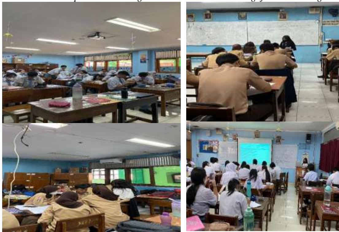
Foto Dokumentasi pelaksanaan Kegiatan MBKM Asistensi Mengajar di SMA Negeri 2 Jakarta