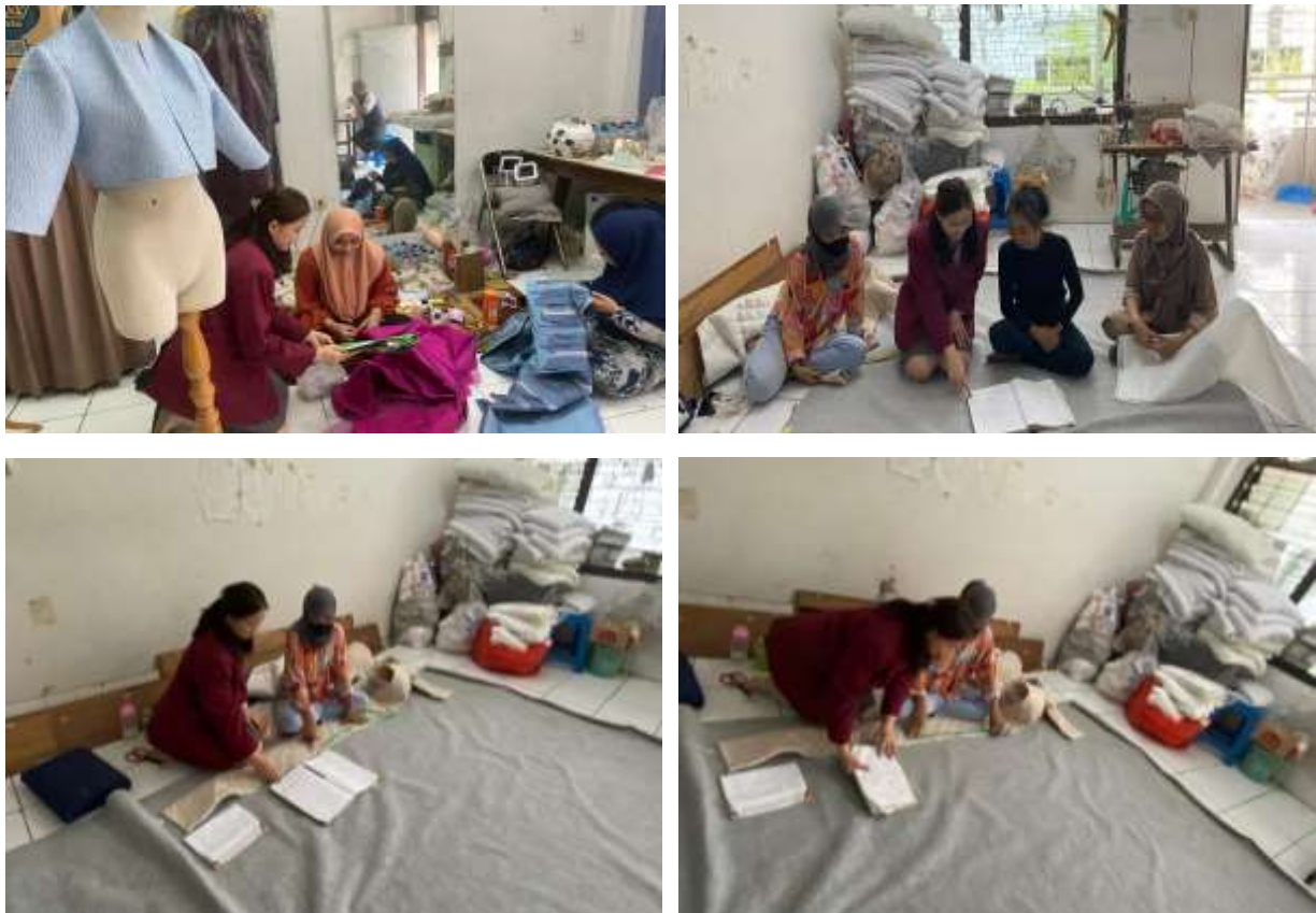
Foto Pelaksanaan Kegiatan PKM